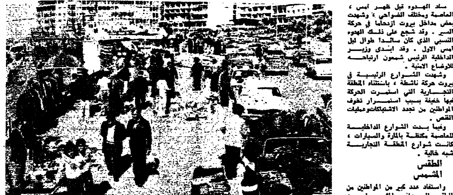
نشاط واسع للسلطات المنتشرة في منطقة الروشة